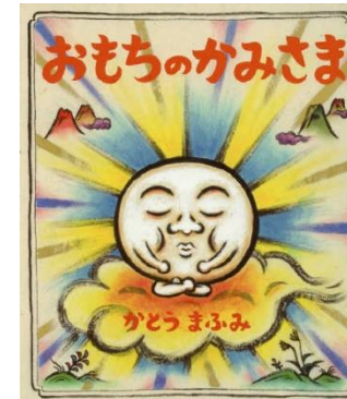
おもちのかみさま/かとう まふみ

「私は特別なおもちだ。食べられるなんて、まっぴらご めん!」。どんな熱い火で焼かれても、決してふくらま ないガンコなおもち。もっと硬くなってやろうと山にこ もって修行をしていると、神さまに声をかけられるの ですが……。