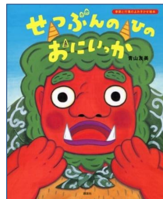
『せつぶんのひのおにっか』 (青山 友美/作)

まこちゃんは、まだしょうずにボールをなげられませんか。おにがくるまえに、豆のかわりにボールでおとうさんとれんしゅうです。そこへおにがやってきました。まこちゃんは、豆まきしょうずにできるかな?