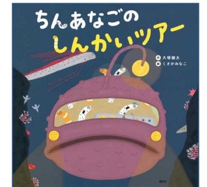
『ちんあなごのしんかいツアー』 (大塚 健太/作)

ひとりの女の子が「せっせせっせ」とバケツで砂をはこんで「ポン」とちいさなお山をつくりました。それを見ていたほかのともだちや、きんじょのひともてつだって砂をはこんでくれます。「せっせせっせっせ…」お山はどんどん大きくなります!