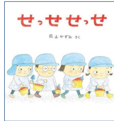
『せっせせっせ』 (花山 かずみ/作)

ひとりの女の子が「せっせせっせ」とバケツで砂をはこんで「ポン」とちいさなお山をつくりました。それを見ていたほかのともだちや、きんじょのひともてつだって砂をはこんでくれます。「せっせせっせっせ…」お山はどんどん大きくなります!