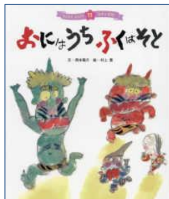
『おにはうち ふくはそと』 (西本 鶏介/作)

いつもはのんびりくらしているおに一家ですが、節分の日にはちがうようです。朝からおとうさんおにはたいそう、おかあさんおにはもつをまとめています。夕方、豆まきが始まりました。おにっかは外へにげだします。どうなるおに一家!