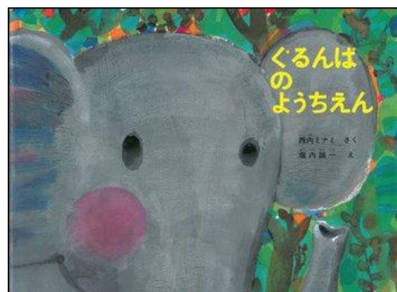
『ぐるんぱのようちえん』 (西内ミナミ/作・堀内誠一/絵)