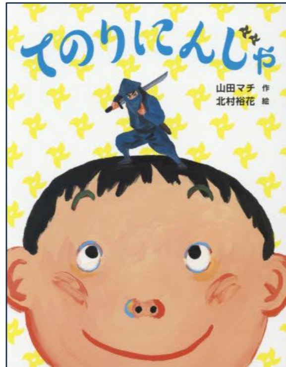
『てのりにんじゃ』 山田マチ（作）北村裕花（絵）

あかい「まぐろあかみ」のおすし、しろい「たい」のおすし、ひかる「こはだ」のおすしって、どんなお魚？ おすしと、おすしになる前の魚がたくさん載っている絵本。おすしの名前や、魚の形・名前が覚えられます。